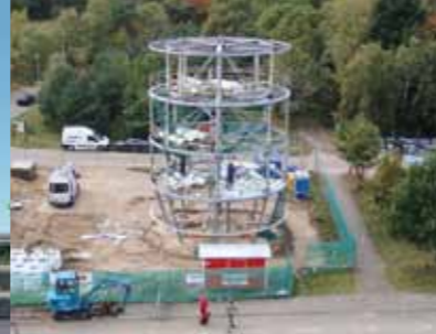
Watertoren, Bussum (Vocus Architecten).