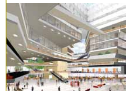
Stadskantoor Utrecht, ontwerp (Dirk Jan Postel/Kraaijvanger•Urbis).