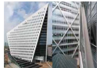
Stadskantoor Leyweg, Den Haag (Rudy Uytenga Architecten).